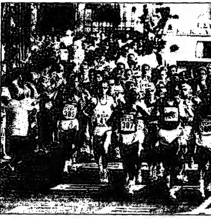
لحظة الانطلاق في ماراثون الرجال خلال بطولة العالم